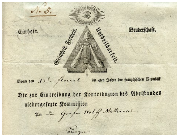
Abbildung 1: Briefkopf der französischen Kommission zur Umlegung und Eintreibung der Kontribution des Adels, Bonn 29. Prairial III (17. Juni 1795).